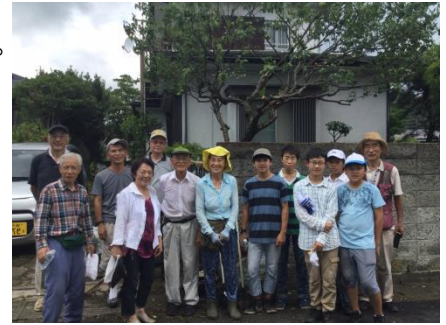
NPO・鎌倉ボランティア部協働草刈り