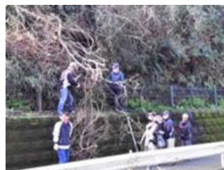
鳥が絡まった大枯れ樹を処理

異常暖冬で早くも町内の玉縄桜、河津桜も満開。コロナ禍で行動もままならぬ中、交通機関を利用せず開放空間で英気を養い免疫力を増すべく恒例活動を快晴の中、急遽実施致しました。防災、防犯上から重要で通学路である今泉台1～3丁目地蔵前街路・5号緑地を2時間半、10名で作業。丁度、緑地の枯れ木が芽吹き、歩道に覆い被る懸案の大木3本も伐採・剪定し安心して通行出来るようにしました。暫くぶりに生き生きと活動し腰痛も治ったとの声も。コロナの影響か、子ども連れ等の方々、車の往来が何時になく多く、行き交う方々から「有難うございま」