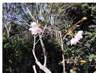
20.3.3雛祭りに合わせる様、初めて開花

2年前に【今泉台さくらを守る会】を発足し初作業として実生から育てた玉縄桜、河津桜3本を滝ノ入北公園に植栽しました。今年は1週間も早いサクラの開花で、当町内もクローバー広場等で満開を迎えた3月3日ひな祭りの日に「北公園の実生の桜」も初めて開花致しました。18年3月30日の投稿記事の“2年後の花を期待”にピタリ。花の色、たたくまいから玉縄桜そのものか河津桜との交雑と思われます。「吉ガ沢桜」と呼称としても良いかもしれません。来年の2本の開花も観て決めましょうか。なお、この桜は今泉台7丁目の夫妻が4年前に実生から苦心して育てたものです。更に10本程を実生から幼木に育成中です。是非皆さまもサクラ友になって楽しみませんか。(御法川)