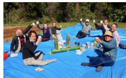
NPO里山菜園での花見

会員数も順調に拡大し3月から子育て家族も参加されています。現在は木曜日9:30~が定例作業日ですが、仕事をお持ちの方向けに日曜日午前中も定例化する予定です。さわやかセンター横で作業していますので、興味のある方は一度覗いてください。(田中則)