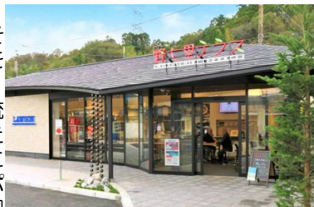
野七里テラス外観

「野七里テラス」はバス停前という立地、コンビニ(ローソン)と交流スペースから成り、食事、喫茶、音楽会、趣味の会、子供が宿題をしたり等自由に使うことが出来ます。また買い物に出にくい高齢者を対象に移動販売車ローソンカーを出しています。大和ハウスはこの上郷ネオポリスの「まちづくり」をテストケースに、同じような問題を抱える全国のネオポリスに広げて行きたいとのことです。(青木)